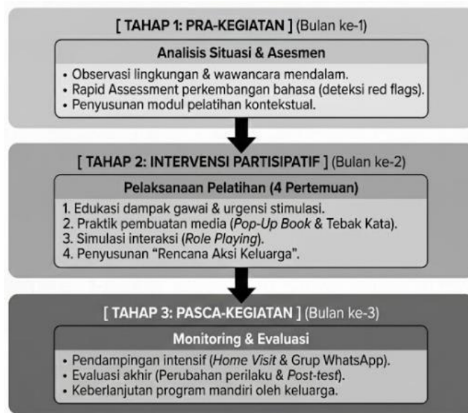
Gambar 1. Bagan Alur Kegiatan Pengabdian

Kegiatan dilaksanakan dalam tiga tahap utama selama periode Juni–Agustus 2024: