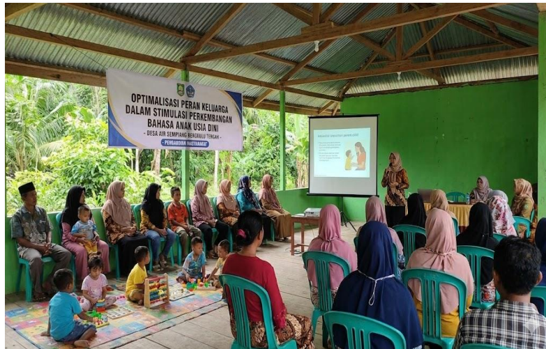
Gambar 2. Materi pelatihan dalam membangun kesadaran kognitif orang tua

menunjukkan efektivitas materi pelatihan dalam membangun kesadaran kognitif orang tua, dapat dilihat pada gambar berikut: